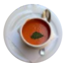
Crema di Pomodoro