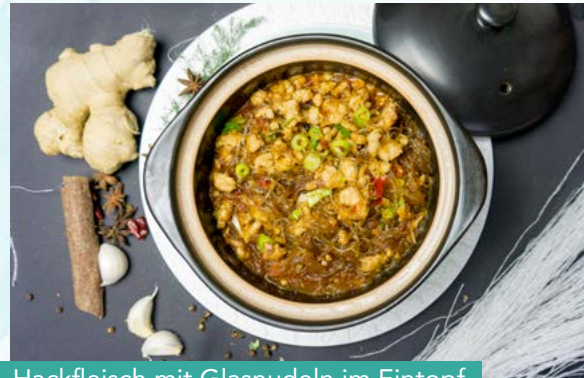
S12. Hackfleisch mit Glasnudeln im Eintopf

Paprika, Porree, Zwiebeln Schwarze Bohnen, Knoblauch