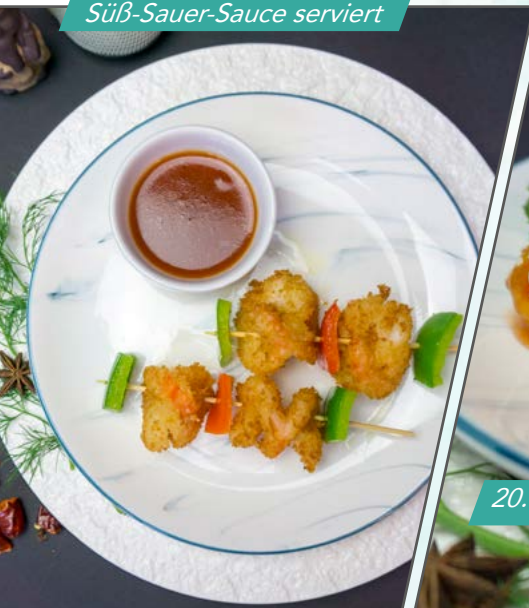
19. Garnelenspieße mit Süß-Sauer-Sauce serviert