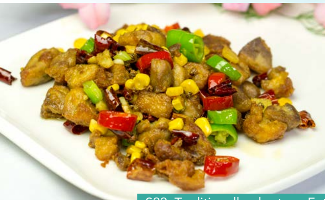
S22. Traditionell gebratene Ente mit Mais