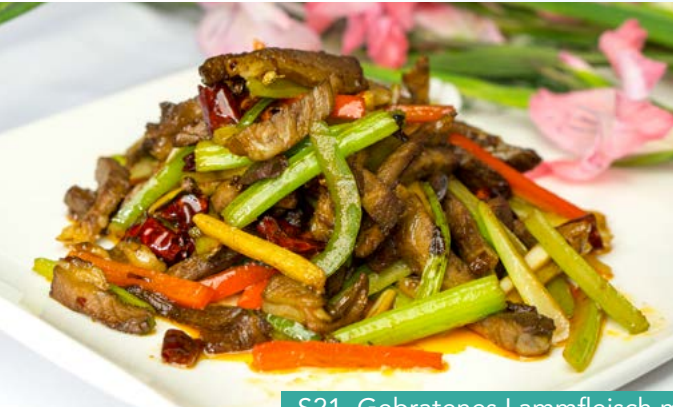
S21. Gebratenes Lammfleisch mit Sellerie