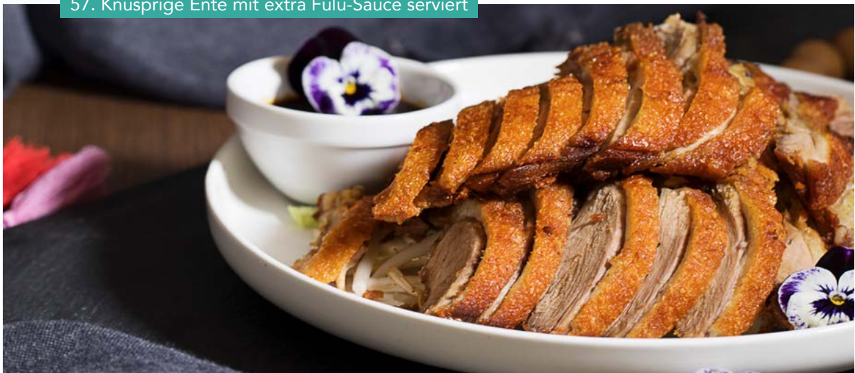
57. Knusprige Ente mit extra Fulu-Sauce serviert