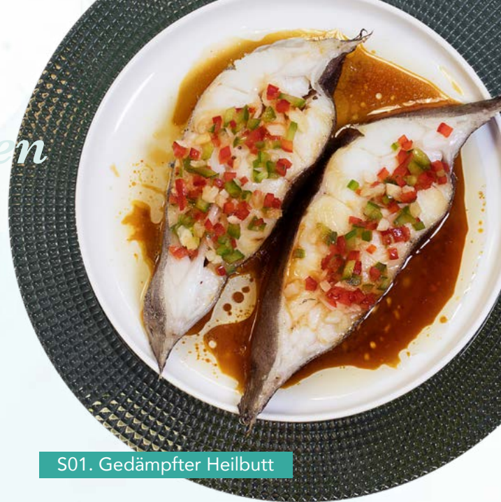
S01. Gedämpfter Heilbutt