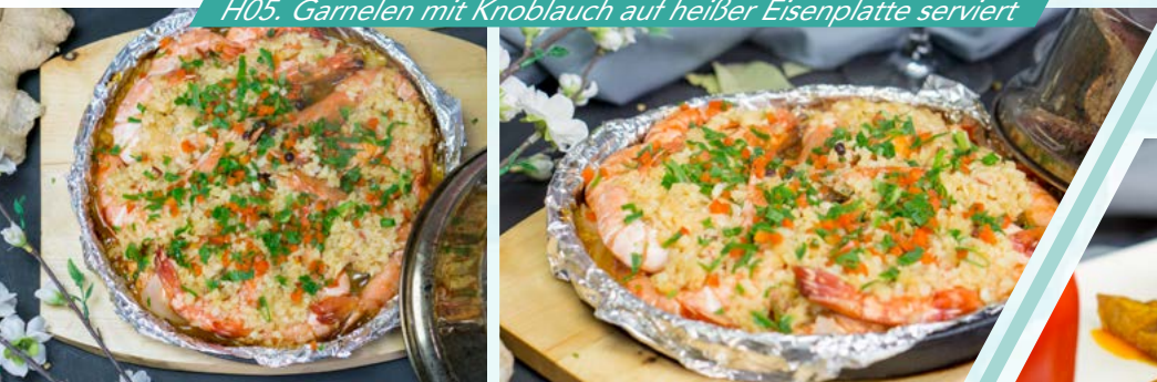
H05. Garnelen mit Knoblauch auf heißer Eisenplatte serviert