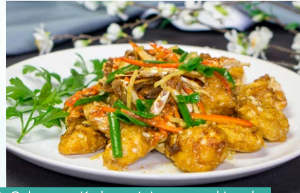
S10. Gebratene Krebse mit Ingwer und Lauch