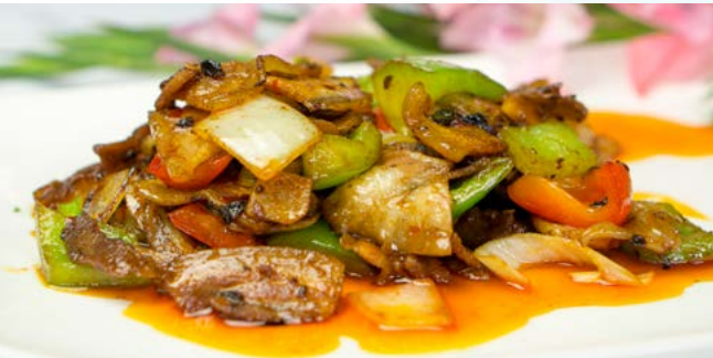
S11. Doppelt gebratenes Schweinefleisch