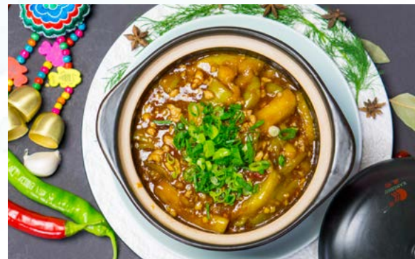
S13. Hackfleisch mit Auberginen im Eintopf