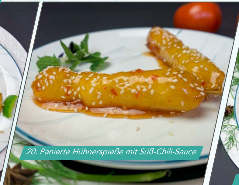
20. Panierte Hühnerspieße mit Süß-Chili-Sauce