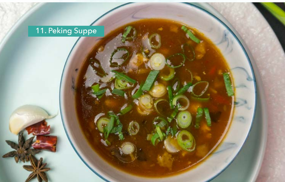
11. Peking Suppe