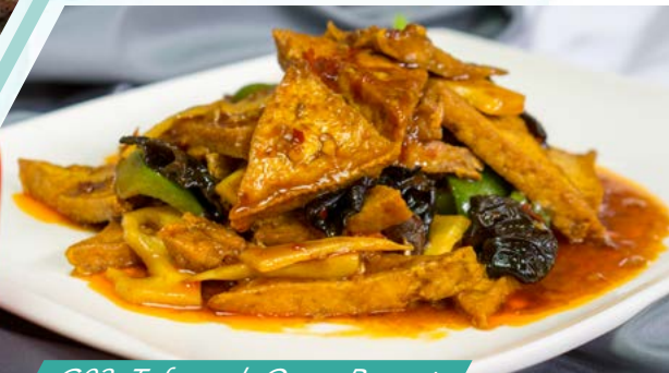
G03. Tofu nach Omas Rezept