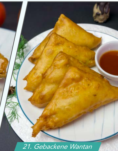
21. Gebackene Wantan mit Süß-Sauer-Sauce

21. Gebackene Wantan mit Süß-Sauer-Sauce serviert, 4 Stk. 1