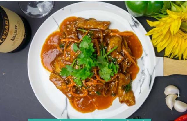
S16. Gebratenes Schweinefleisch in Süß-Sauer-Sauce