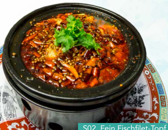
S02. Fein Fischfilet-Topf auf Feuer